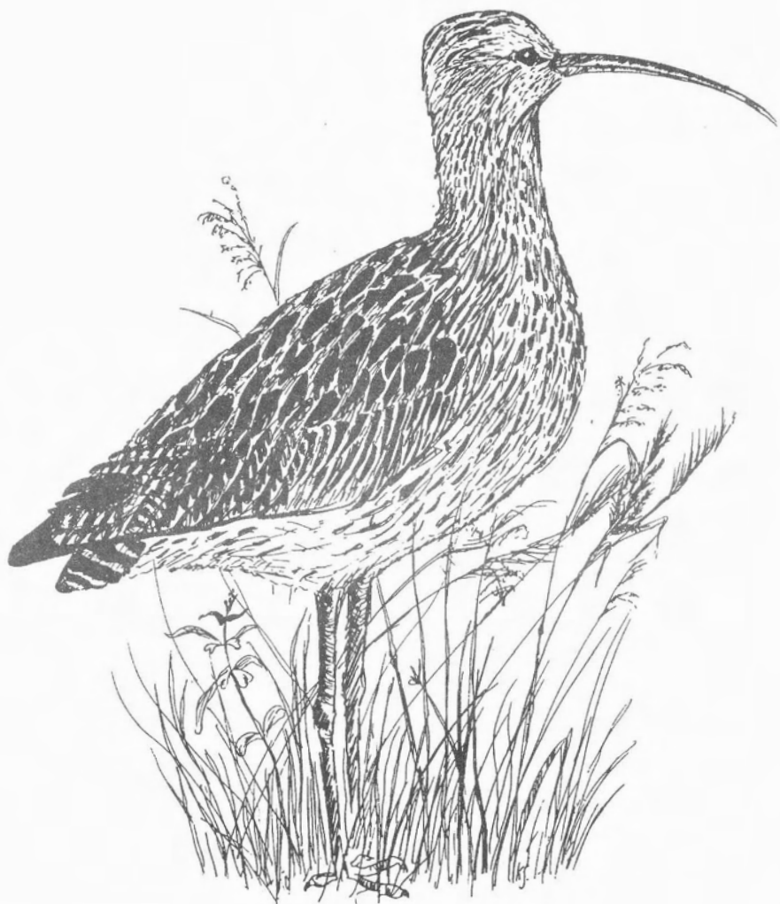
KATRIN SEERVÄLD "Suurkoovitaja" I koht vanuseklassis B.