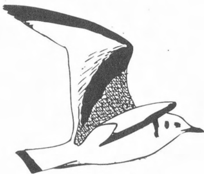
Kaljukajakas ( Rissa tridactyla) 11.11.1995 Põõsaspea neem.

Edaspidi käsitleb HK ainult 1997. ja varasematel aastatel tehtud vaatlusi.