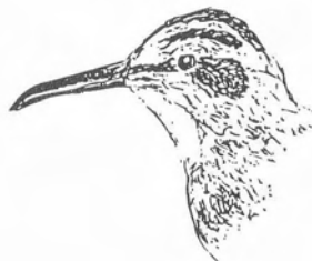
Plütt ( Limicola falcinellus) 28.08.1994 Pikla.