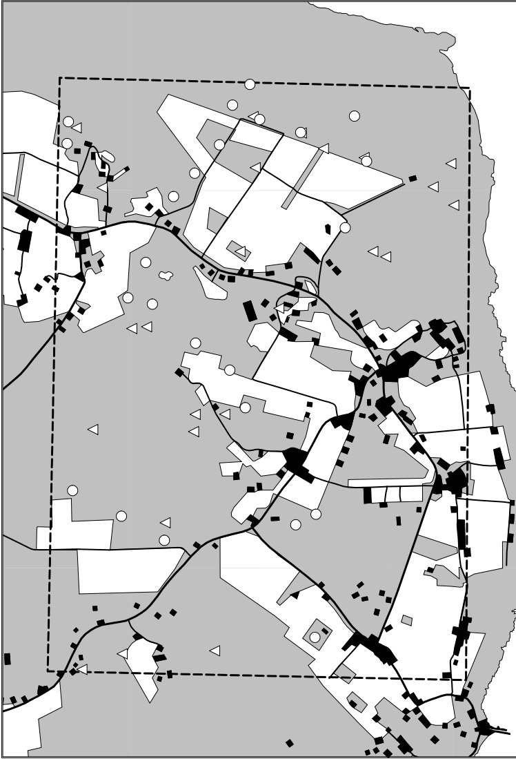
Joonis 1. Emmaste vaatlusalala Lõuna-Hiiumaal, kus valged täpid tähistavad hiireviipesi ning kolmnurgad juhupunkte. Metsad on esitatud hallina, majad ja teed mustana, punktirjoon tähistab vaatlusalala piiri.

Figure 1. Emmaste study area in southern Hiiu County. Nests of Common Buzzards are indicated as white dots and random points as white triangles. Gray areas are forests, black boxes are houses and black lines are roads. The study area is bordered by the dotted line.